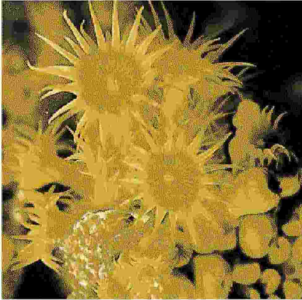
LE CREATURE DEGLI ABISSI Una delle immagini in mostra, opera dello spezzino Leonardo d'Imporzano